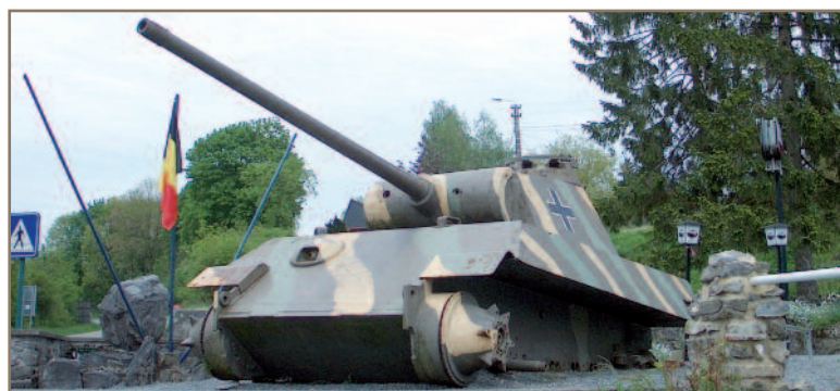
Une défense pour le XXIe siècle ou un musée? Est-ce bien de cela que nous avons besoin? (ici un exemple pris hors de nos frontières)

Sauf que ce concept si désarmant de simplicité ne résiste pas long-